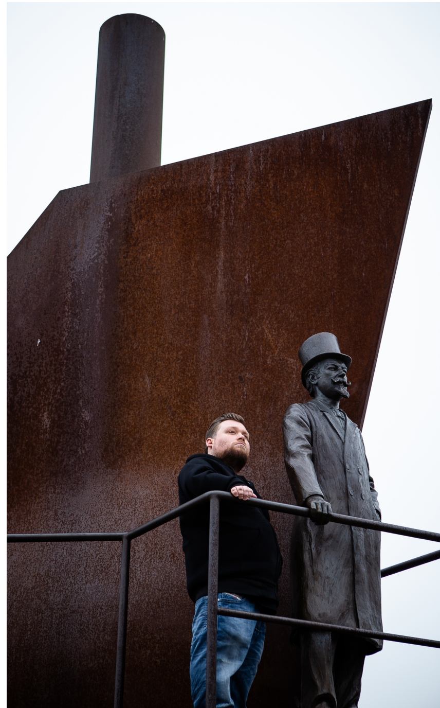
‘In mijn jeugd heb ik me een tijdje afgezet tegen mijn vader en zijn oorlogsverleden, maar dat heb ik later ruimschoots goedge maakt.’

‘Ja. Ik had een bepaalde lijn uitgezet, namelijk dat het mij moeilijk viel om dertig te worden. Mijn verjaardag viel in dezelfde periode en de dood van papa zette dat idee in een heel ander perspectief, maakte het minder belangrijk. De levensvragen die mijn generatie zo belangrijk acht, de keuzestress waar wij mee worstelen, de ik-punten die we vooropstellen: wat stelt het eigenlijk allemaal voor?’